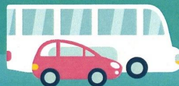
VÉHICULE PERSONNEL OU TRANSPORTS EN COMMUN